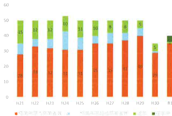
修業年限内退学率

また令和3年度は、留年しても諦めずに卒業した学生が1人（+1年卒が1名）おり、国家試験に合格している。粘り強く卒業まで指導するという本校教員の姿勢が学生にも伝わりつつあると考えられる。